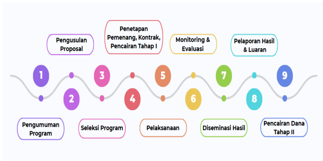
Gambar 1. Jadwal Tentatif Pelaksanaan Program Penelitian

Dana tahap II sebesar 50% akan dicairkan apabila peneliti sudah menyelesaikan luaran wajib, dengan melakukan publikasi hasil penelitian pada jurnal baik nasional maupun internasional pada jurnal bereputasi sesuai ketentuan, minimal berstatus diterima ( accepted ) dengan melampirkan LoA ( Letter of Acceptance ).